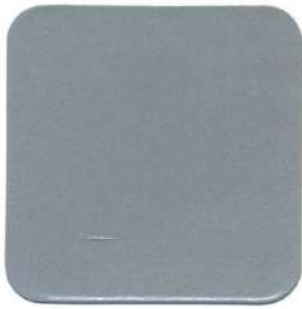
215 Plata Oxilux