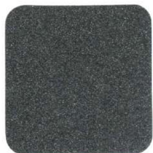
001 Negro Forja