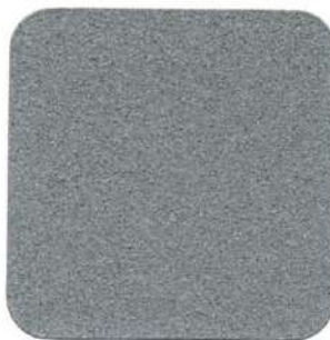
002 Gris Acero