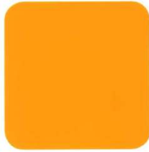
412 Amarillo Albalux