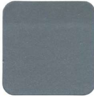
015 Aluminio Albalux Exteriores 115 Aluminio Albalux Antialóxico