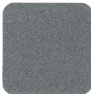
002 Gris Acero