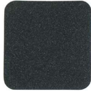
001 Negro Forja