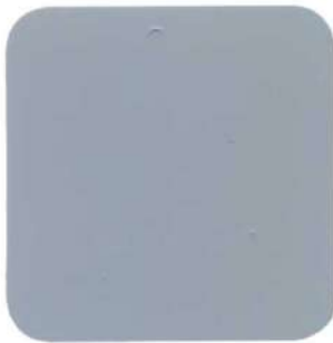
423 Gris Perla Albalux