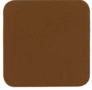
473 Ocre Albalux