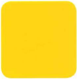
429 Amarillo Real Albalux