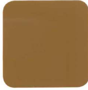
419 Gamuza Albalux