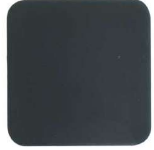
465 Gris Medio Albalux