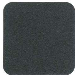
001 Negro Forja