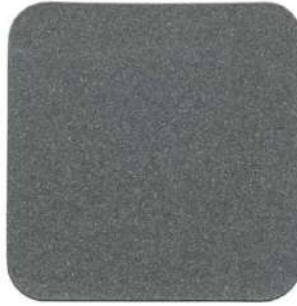
002 Gris Acero